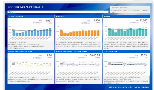
※画像は「自動集計レポートAdvance」のものです。